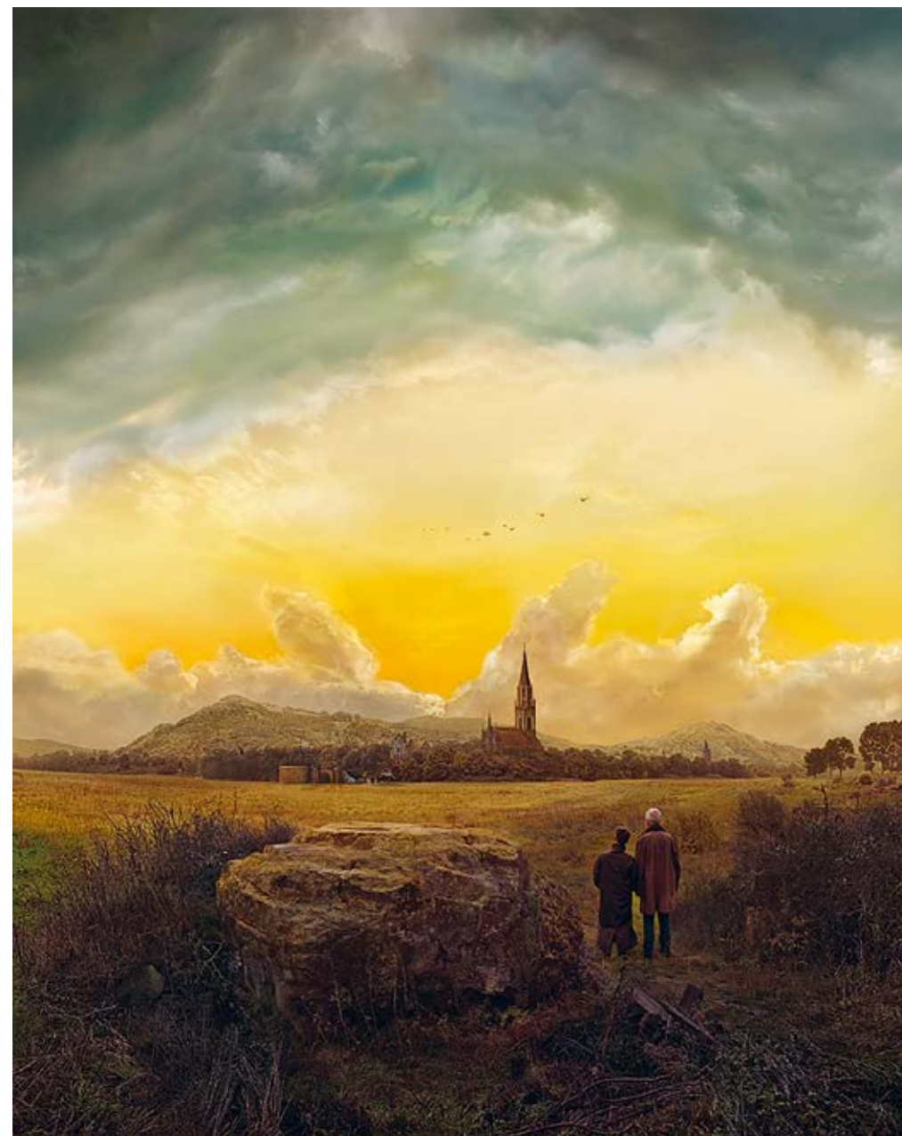
50 Hiroyuki Masuyama, After C. D. Friedrich, Neubrandenburg 1816/17, No. 03, 2022 , LED Lightbox 91 × 72 × 4 cm, Hiroyuki Masuyama