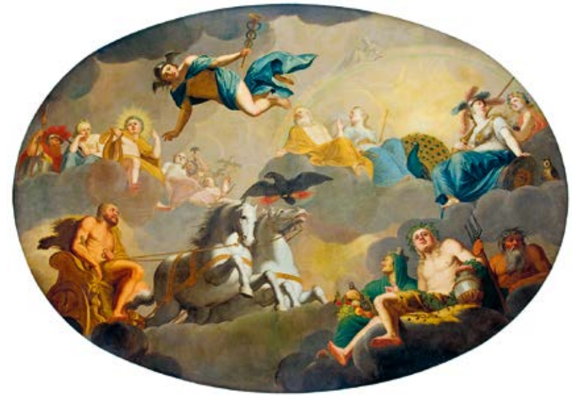
8 Jacob Samuel Beck Die Apotheose des Herkules , um 1737 (Deckengemälde aus Gut Stedten), Öl auf Leinwand Angermuseum Erfurt

Eine Apotheose bildet auch das zentrale Thema eines um 1737 entstandenen Deckengemäldes von Jacob Samuel Beck (1715-1778). Es schmückte ursprünglich den Hauptsaal des südlich von Erfurt gelegen und 1948/49 abgerissenen Guts Stedten und wurde in die Ausstellungensräume des Angermuseums Erfurt integriert (Abb. 8). Dargestellt ist der Aufstieg des antiken Helden Herkules, der nach seinen Taten in den Olymp der Götter aufgenommen wird. Von links unten kommend, erreicht Herkules in einem von zwei Pferden gezogenen Wagen den himmlischen Wohnsitz der auf dichten Wolken thronenden Götter. Das Gemälde steht beispielhaft für einen Typus barocker Deckengemälde, in denen Wolken als zentrale Motive die dem Irdischen entrückte göttliche Sphäre markieren.