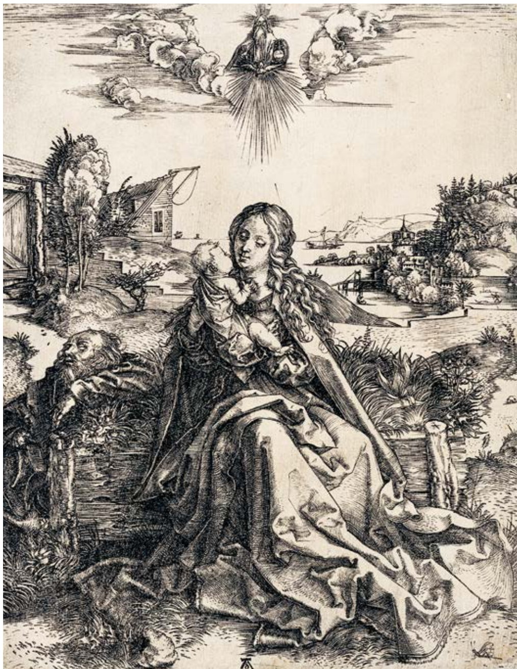
5 Albrecht Dürer Die Heilige Familie mit der Heuschrecke , um 1495 Kupferstich, 24 × 18,6 cm Graphik-Kabinett Backnang