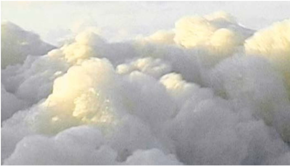
35 Ursula Palla, Clouds and Foam 30. Juni 2004 – 10. August 2019 Video, 4:30 Min., Courtesy the artist

Ursula Palla (*1961) richtet in ihrem Video Clouds and foam (Wolken und Schaum) den Blick auf den Schaum von Meereswellen, den sie am Strand von Norderney beobachtete (Abb. 35). In der Nahaufnahme ähneln die wabernden Schaumwolken beinahe Himmelswolken. Das scheinbar harmlose Naturschauspiel verweist auf gravierende ökologische Probleme: Die Ursachen für die zunehmende Bildung von Schaumwolken etwa an Ost- und Nordsee liegen vor allem in der Algenvermehrung durch Überdüngung, in der Schadstoffbelastung durch hochgiftige PFAS-Substanzen und in den steigenden Temperaturen an Land und im Wasser.