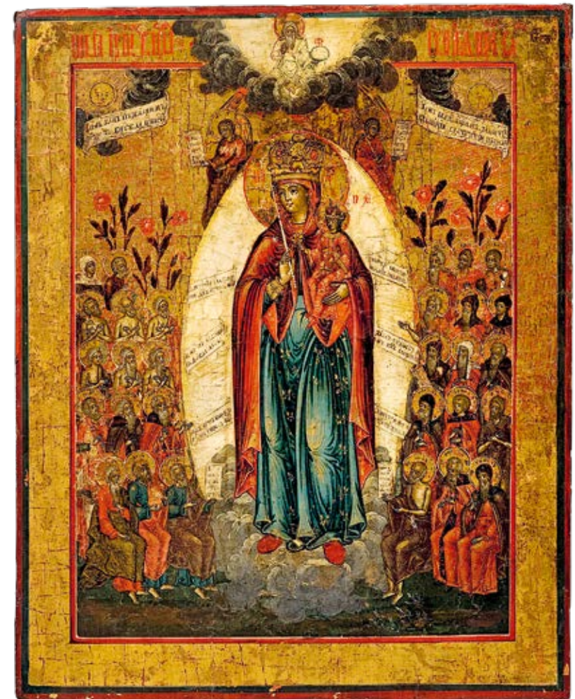
6 Gottesmutter „Freude aller Leidenden“ Russland, frühes 19. Jahrhundert Eitempera auf Holz, 35,5 × 28,6 cm Angermuseum Erfurt