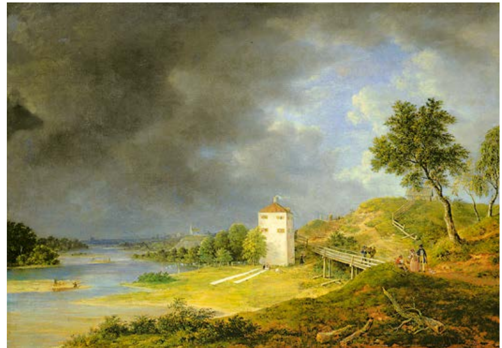
26 Johann Jakob Dorner d. J. Isarlandschaft beim Brunnhaus in Brunenthal , um 1834 Öl auf Leinwand, 59 × 84 cm Museum Georg Schäfer, Schweinfurt

als Staffagefigur und von Details aus der Gegenwart, wie etwa Windkraftanlagen am Horizont, verstärkt diese Aktualisierung. Eine ganz besondere Präsenz und Wirkung gewinnen die für Friedrichs Kunst so bedeutenden erhabenen Himmels- und Wolkenlandschaften durch die Hinterleuchtung, sei es, dass der abendliche Himmel über Neubrandenburg in ein atemberaubendes, nach oben hin bedrohliches Farbspektakel getaucht wird oder dass sich ein Regenbogen glasklar vor einem düsteren Gewitterhimmel aufspannt (Abb. 27, 50).