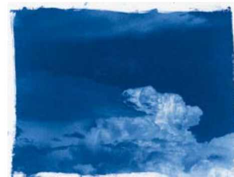
47 Simon Roberts, A Daily Sea , 2020/2025 16 Videostills aus dem Video, 2:11 Min. Robert Morat Galerie, Berlin