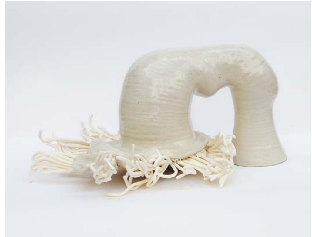
36 Yvonne Roeb, Circular , 2018 Keramik, Craquelé, Polystyrol, 26,5 × 40 × 56 cm Yvonne Roeb

Extremitäten. In ihrer Skulptur Circular greift die Künstlerin die natürlichen Prozesse der Natur und ihre visuelle Darstellung auf (Abb. 36). Der Titel verweist auf den endlosen Kreislauf des Wassers, der in der Wolkenbildung, Verdunstung und dem anschließenden Regen seine Fortsetzung findet.