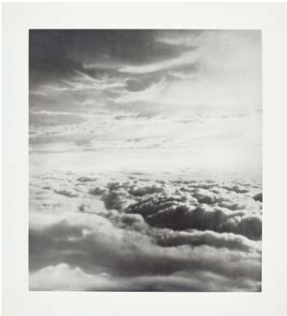
41 Gerhard Richter, Wolken , 1969 Offsetdruck auf Karton, 45 × 39,9 cm Griffelkunst-Vereinigung Hamburg e.V.

Das nur ein bis zwei Jahre vor Richters Fotografie in den Jahren 1967/68 entstandene Künstlerbuch Clear Sky des bedeutenden US-amerikanischen Künstlers Bruce Nauman (*1941) ist ebenfalls ein Beispiel für „konzeptuelle Himmelsbilder“. Das Buch enthält 10 ganzseitige Farboffsetlithografien. Sie zeigen monochrome Farbflächen in unterschiedlichen Blautönen, die einen wolkenlosen Himmel suggerieren. Nauman spielt mit der Erwartungshaltung und der Imagination des Betrachters, der auf Grund des Titels Fotos eines klaren Himmels zu sehen glaubt, während es sich tatsächlich nicht um Fotografien, sondern um mit Tinte bedruckte Papierseiten handelt.