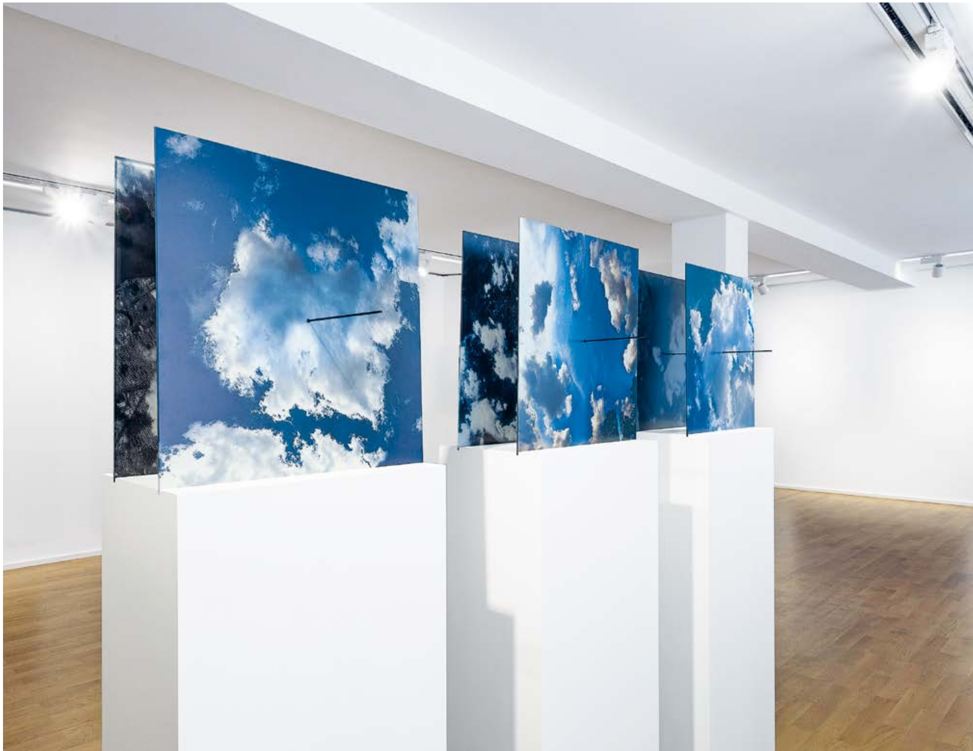
40 Lyoudmila Milanova, Seeing clouds from both sides 2016/2022, sechs Fotografien auf Glas gedruckt je 44 x 44 cm, Lyoudmila Milanova