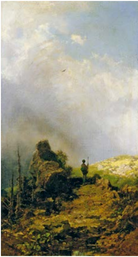
25 Carl Spitzweg, Der Adlerjäger , 1870 Öl auf Leinwand, 63,1 × 35,1 cm Museum Georg Schäfer, Schweinfurt

Seine durch LED-Lichtkästen hinterleuchteten Fotoarbeiten, deren Größe den Originalen entsprechen, entstanden meist aus 300 bis 500 zusammengesetzten Detailfotografien, die Masuyama an Originalschauplätzen des Romantikers aufnahm. Caspar David Friedrich experimentierte selbst mit hinterleuchteten Transparentbildern, von denen nur wenige erhalten sind. So lässt sich Masuyamas Medientransfer bei allem Rückbezug auf die überlieferten Gemälde auch als eine Form von Vergegenwärtigung des Romantischen mit heutigen technischen Möglichkeiten verstehen. Auch das Einbeziehen der eigenen Person