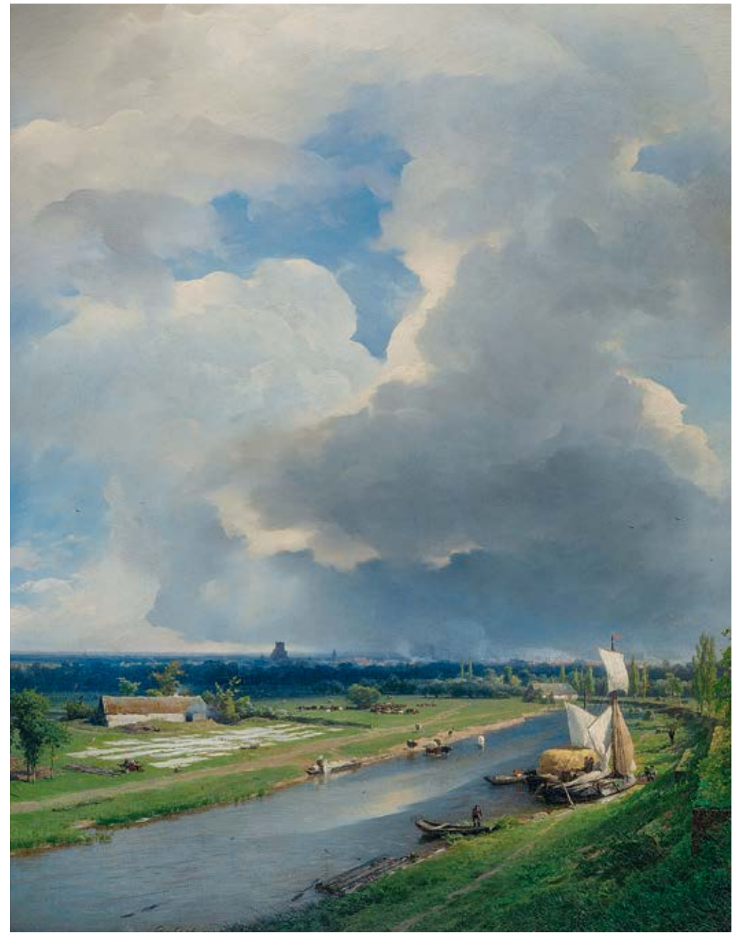
24 Andreas Achenbach, Blick auf Neuss , 1871 Öl auf Leinwand, 126,5 × 98 cm Museum Georg Schäfer, Schweinfurt

Der 1968 in Japan geborene Künstler Hiroyuki Masuyama verfolgt in einem umfangreichen, äußerst akribischen Projekt eine Transformation von Gemälden Caspar David Friedrichs in das Medium der Fotografie.