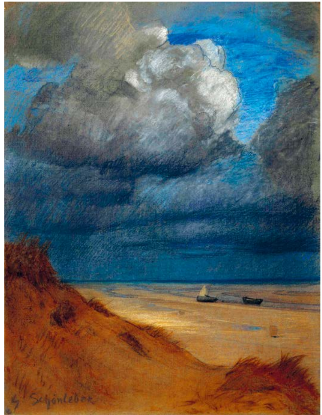
28 Gustav Schönleber, Gewitterstimmung bei La Panne , 1889 Kohle, Pastellkreide auf Büttenpapier, 90 × 70 cm Städtische Galerie Bietigheim-Bissingen

Walter Strich-Chapell (1877-1960), ein Schüler von Gustav Schönleber, konzentrierte sich im Unterschied zu seinem Lehrer vor allem auf die heimatliche Landschaft der Schwäbischen Alb. In seinen klar strukturierten Landschaftskompositionen sind es in erster Linie die differenziert gemalten Wolken, die den Bildern ihre Lebendigkeit und atmosphärische Wirkung verleihen (Abb. 30).