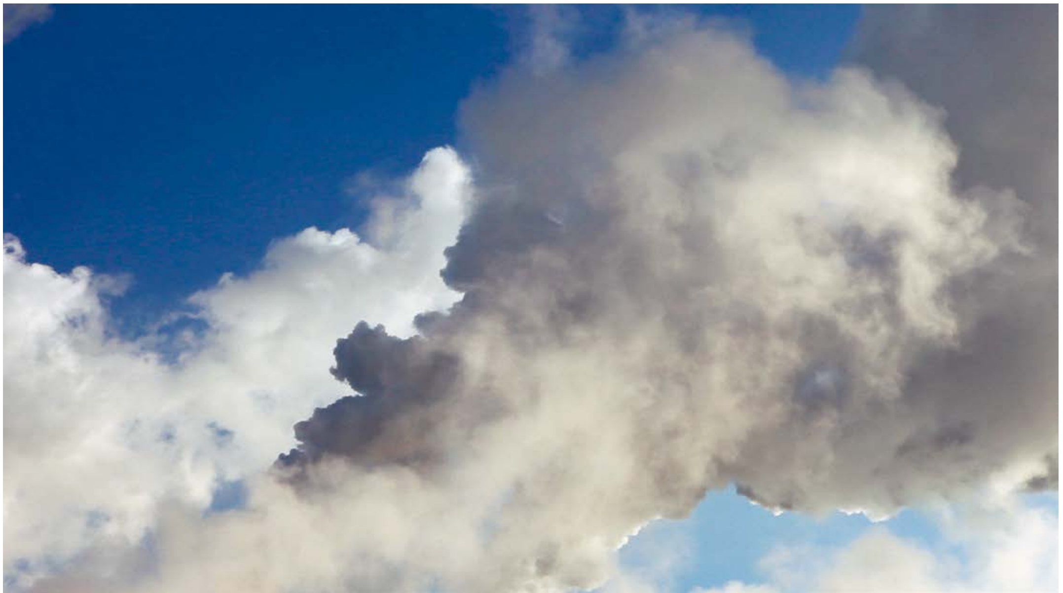
42 Almut Linde, Dirty Minimal #70.1 – Wolkenmeer/29,3 Tönnen CO 2 (Braunkohlekraftwerk, Frimmersdorf) , 2012 HD-Video, 3:08 Min.