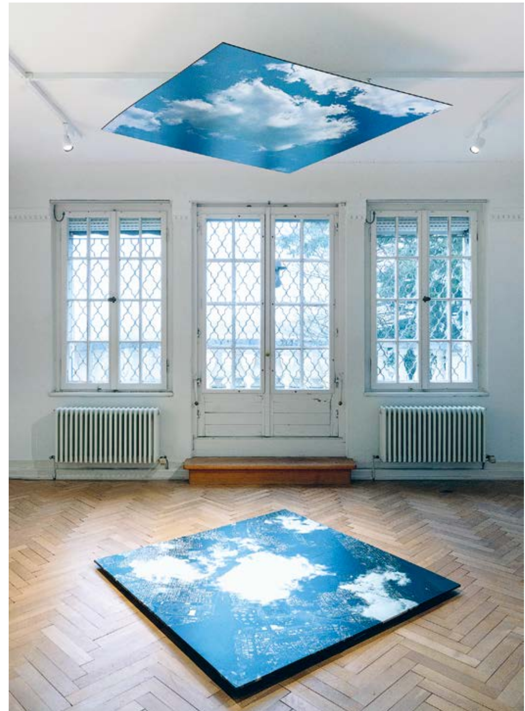
39 Lyoudmila Milanova, Seeing clouds from both sides , 2015/2023 Fotodruck auf Holz, je 145 × 145 cm, Lyoudmila Milanova

Eine gleichermaßen sehnsuchtsvolle Verheißung wie auch einen kritischen Umgang mit dem eigenen Bildmedium kennzeichnet ebenso Gerhard Richters (*1932) Fotografie Wolken von 1969 (Abb. 41). Was aussieht wie ein sich nach allen Seiten ausbreitendes unendliches