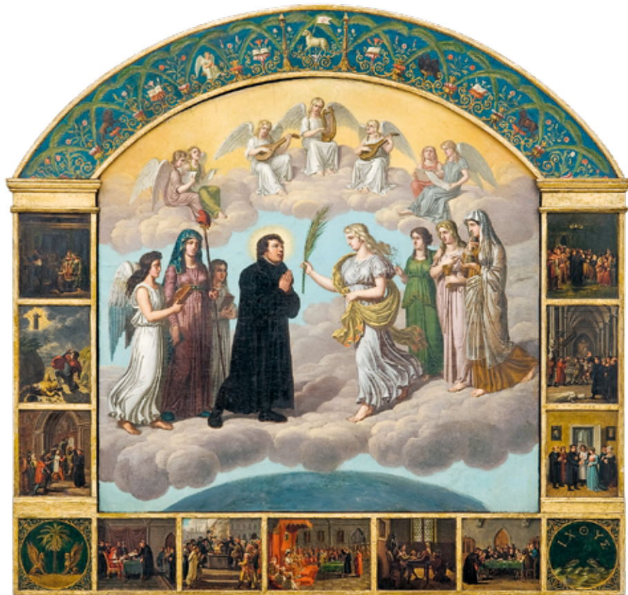
7 Johann Erdmann Hummel Apotheose (Verherrlichung) Luthers , um 1806 Öl auf Leinwand, Rahmen Öl auf Holz, 71,5 × 73,8 cm Angermuseum Erfurt

Johann Erdmann Hummel (1759-1852) gemalten Bild Apotheose (Verherrlichung) Luthers wird der Reformator als Wiederhersteller der religiösen Freiheit gefeiert (Abb. 7). Auf einem dichten Wolkenteppich im Himmel stehend und von allegorischen Figuren umgeben, empfängt Luther von der Gnade einen Palmzweig als Symbol des Sieges. In der Entstehungszeit des Gemäldes, die von den Napoleonischen Kriegen geprägt war, wurde Luther als Nationalheld und deutsche Identifikationsfigur verehrt. Hummel verklärt ihn in seinem altarähnlichen Bild wie einen Heiligen.